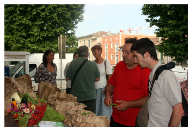
Vente des Paniers Fraîcheurs en gare de Lunel (34)