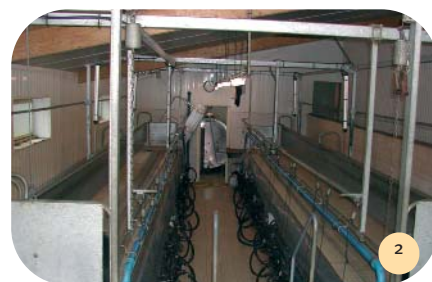
Vue de la salle de traite.