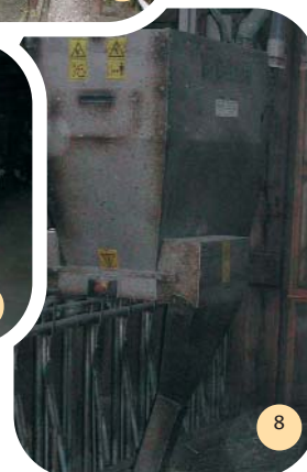
Distributeur automatique de concentrés.