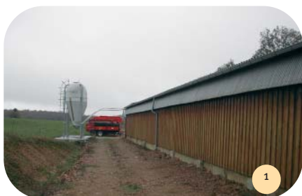
Vue du long-pan et stockage des aliments.