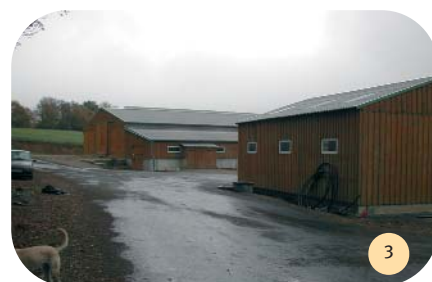
Bardage bois sur atelier et chèvrerie (arrière-plan).