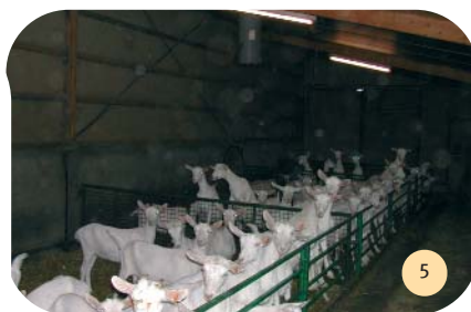
Vue de la nurserie.