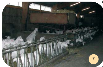
Pré-stockage de la paille sur pivot.