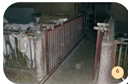
Couloir d'accès à la salle de traite.