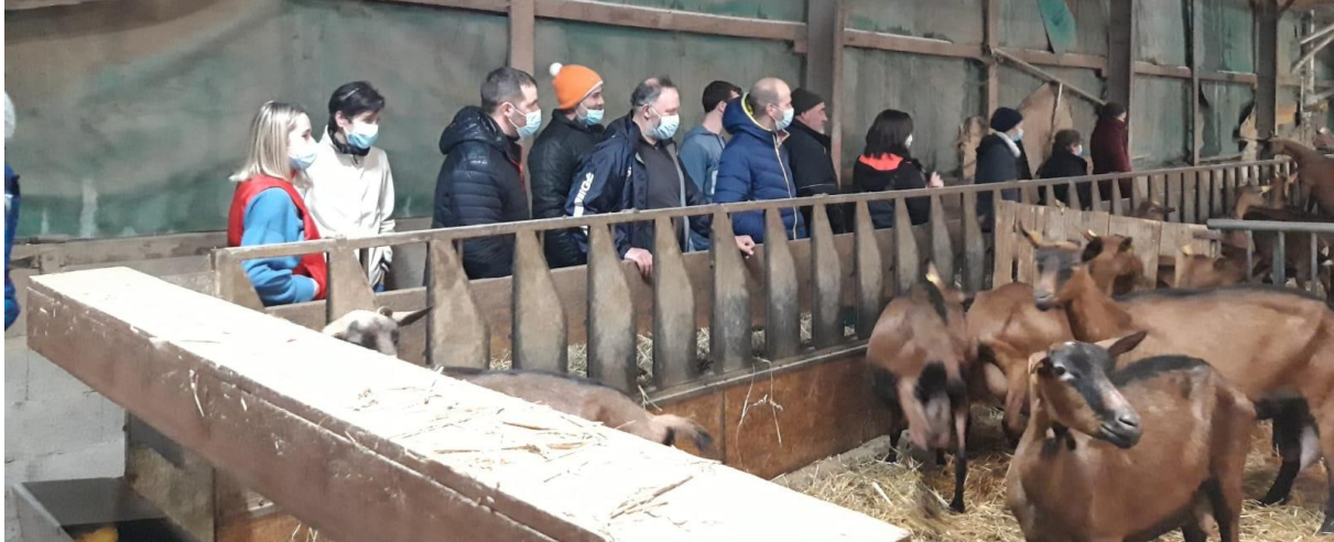
GAEC La Carlarié, Albine (Tarn)