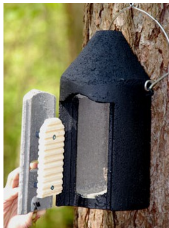
Nidoir à chauve souris