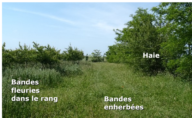
Exemples de connexions paysagères, vergers de pruniers bio d'Invenio, Prayssas

En revanche, les routes, les voies ferrées, les chemins, les carrières... sont autant de ruptures paysagères que la faunes auxiliaires ne peut pas franchir.