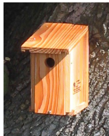
Nidoir à mésanges