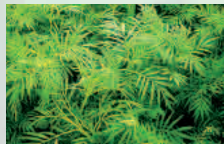
Les tagetes minuta ont des propriétés nématocides vis-à-vis de Meloidogyne