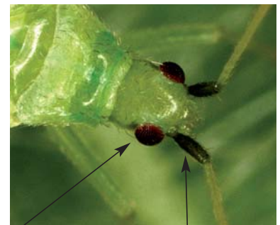
Premier article noir