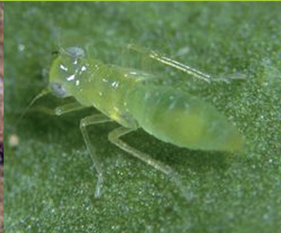
Larve de Cicadelle