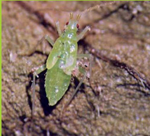
Larve de Macrolophus pygmaeus