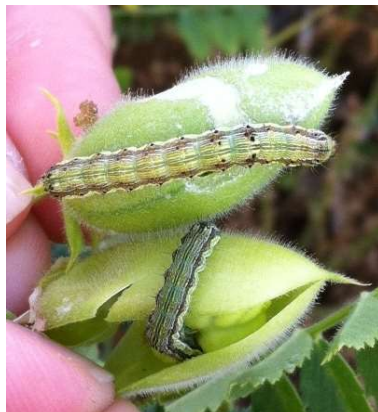
Chenilles d' H. armigera dans gousses de pois chiche

Le suivi de ce ravageur est réalisé avec des pièges en végétation qui permettent de détecter la présence de papillons et suivre les vols. Pour 2020, 34 pièges sont déployés sur le territoire.