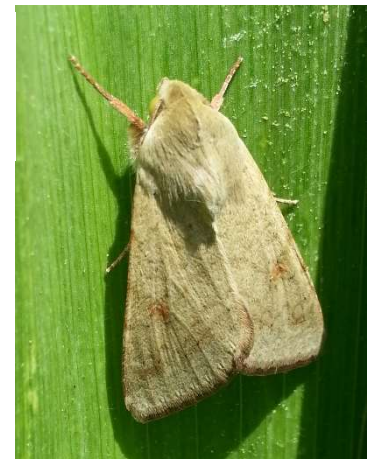
Papillon d' H. armigera - Ph Papillon d' H. armigera