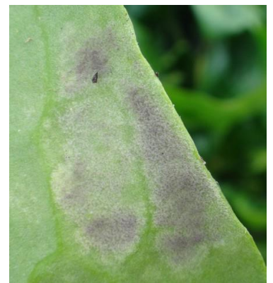
Symptômes de mildiou sur épinard A gauche : face supérieur – A droite : face inférieure