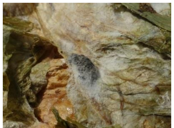
Sclérotinia sur salade et scléroties

Lutte alternative : Pour le Botrytis et le Sclérotinia, il est possible d'utiliser, notamment en agriculture biologique, un produit à base de Bacillus amyloliquefaciens .