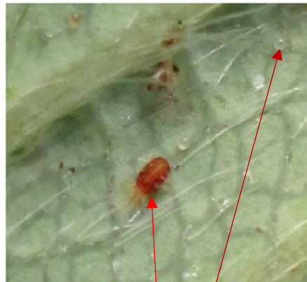
Acariens forme mobile et œufs

Lutte alternative : Il est possible d'utiliser des produits de biocontrôle, homologués également en agriculture biologique, à base de champignon entomopathogène Beauveria bassiana .