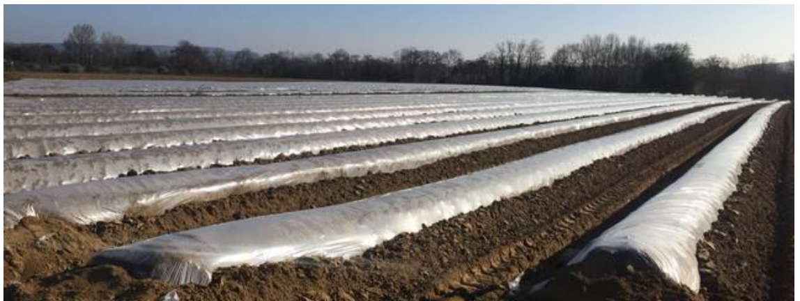
Asperges buttées et couvertes – Photo CA30