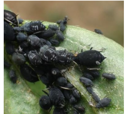
Aphis fabae

Pour le moment nous n'observons pas de problème sanitaire particulier.