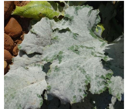
Oïdium sur courgette

http://agriculture.gouv.fr/quest-ce-que-le-biocontrôle . Contactez votre technicien.