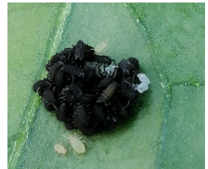
Naissance de coccinelles

Techniques alternatives : La présence d'auxiliaires indigène comme les coccinelles permet de limiter l'évolution des populations.