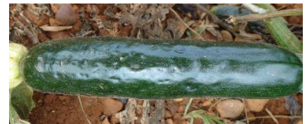
Virose sur courgette