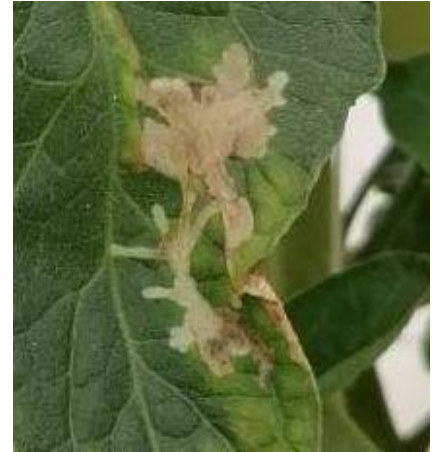
Dégâts Tuta absoluta sur tomate

Il est conseillé de faire des lâchers de Trichogrammes qui parasitent les œufs de Tuta , de mettre en place de pièges à phéromone pour suivre l'évolution des vols. De même il est possible depuis le 13 juillet 2018, de mettre en place, en complément des autres méthodes de lutte, une lutte par confusion sexuelle au moyen d'1 diffuseur de phéromone pour 10m 2