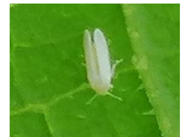
Trialeurodes vaporariorum (en haut) et Bemisia tabaci (en bas)