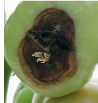
Cul noir

Techniques alternatives : Bien gérer l'irrigation tant au niveau des quantités que de la régularité et amener du calcium au goutte à goutte ou en foliaire (25-50 kg/ha de Nitrate de Chaux/semaine au goutte à goutte).