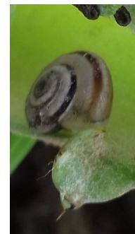
Escargot – Photo SICA CENTREX

L'utilisation de moyens de bio-contrôle est possible et efficace sur cette cible : http://agriculture.gouv.fr/quest-ce-que-le-biocontrole . Contactez votre technicien.