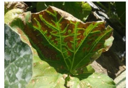
Grille physiologique - Photo CA30

Techniques alternatives : Pour limiter la grille physiologique, il faut assurer une alimentation correctrice en magnésium (nitrate de magnésie ou sulfate de magnésie) en application foliaire.