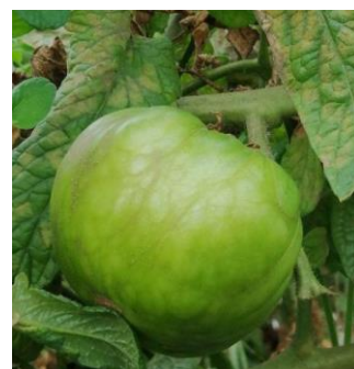
Mildiou sur tomate