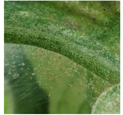
Dégâts d'acariens sur tomate

Techniques alternatives : L'utilisation de moyens de bio-contrôle est possible et efficace sur cette cible : http://agriculture.gouv.fr/quest-ce-que-le-biocontrôle . Contactez votre technicien.