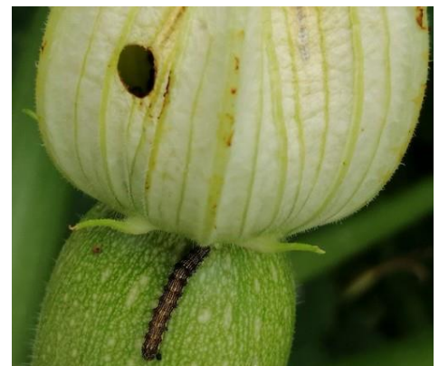
Dégâts noctuelle

http://agriculture.gouv.fr/quest-ce-que-le-biocontrôle . Contactez votre technicien.