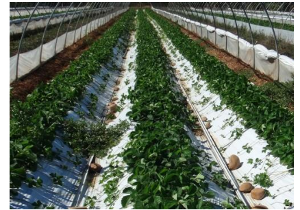
Plantation plants frigos – Photo CA30

Techniques alternatives : L'utilisation de moyens de bio-contrôle est possible et efficace sur cette cible : http://agriculture.gouv.fr/quest-ce-que-le-biocontrôle . Contactez votre technicien.