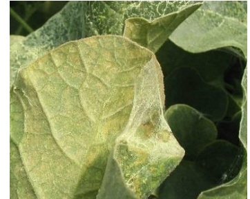
Acariens - Photo CA30