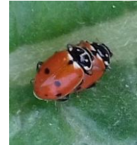
Pucerons (en haut) Coccinelles (en bas) – Photo SICA CENTREX