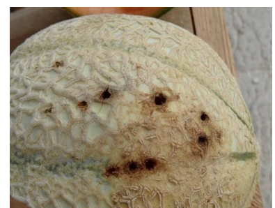
Dégâts Taupin

Lutte alternative : A ce stade de la culture il n'y a aucun moyen de lutte.