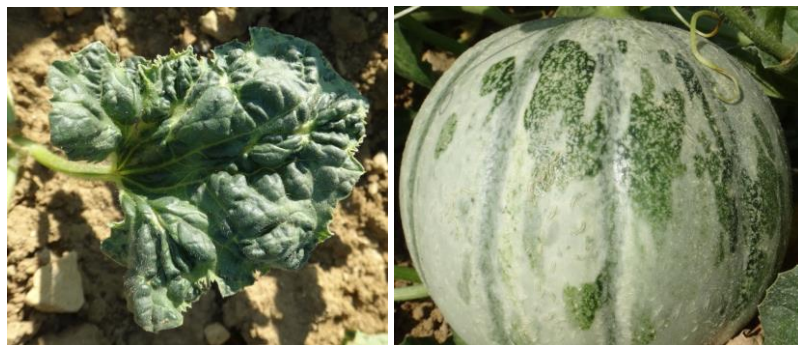
Virus sur melon - Photo CA30

Mesures prophylactiques : il faut être vigilant pour détecter les premiers foyers et arracher les plants infestés puis surveiller leur évolution.