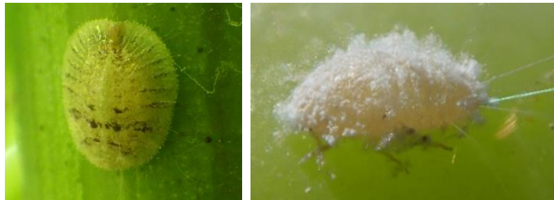
Cochenille Lécantine (à gauche) et Cochenille farineuse (à droite)