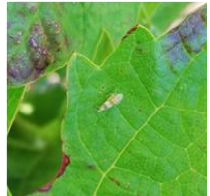
Larve cicadelle L4 vectrice de la flavescence dorée

Ces dégâts sont observés jusqu'à la chute des feuilles.