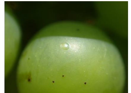
Eudémis : ponte fraîche

Sur certaines parcelles, les vers de grappes atteignent les stades L4 voire L5.