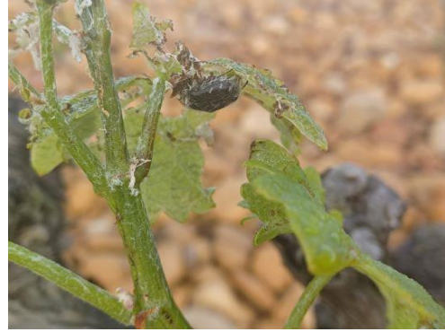
Cétoine velue et ses dégâts sur feuille