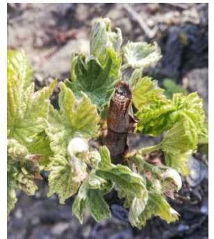
Symptôme drapeau sur Carignan

Les symptômes sur feuilles sont visibles sur Carignan avec ou sans drapeaux.