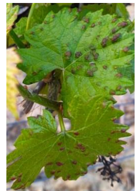
Symptômes avec boursouflures face supérieure sur cépage Chardonnay

Évaluation du risque : à ce jour, le risque est en augmentation.