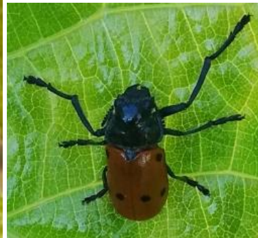
Adulte de Lachnaia paradoxa