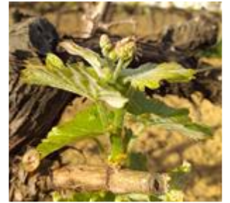
« 5 ou 6 feuilles étalées, inflorescences visibles » (stade 12 ou F ou BBCH 14-53)

Le stade majoritairement observé est « 5 ou 6 feuilles étalées, inflorescences visibles » (stade 12 ou F ou BBCH 14-53).