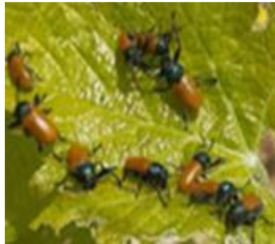
Malcosome du Portugal

Évaluation du risque : risque très faible