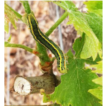
Larve de Xylena exsoleta en train de manger une feuille

Quelques dégâts sont observés dans les parcelles où elles sont présentes.