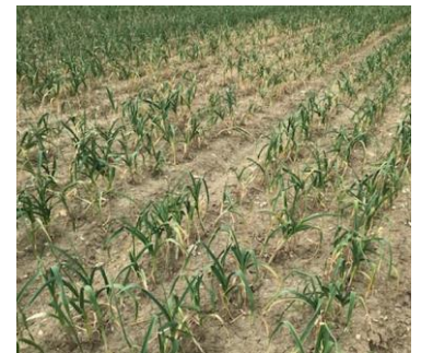
Rond de « gamme »

Toutes les mesures permettant de limiter l'expansion de la zone de contamination de la parcelle ainsi que l'augmentation du stock de sclérotés doivent être prises. Il est également important d'observer les parcelles pour identifier dès à présent les éventuelles zones contaminées : le point de démarrage et la progression. Pensez également à le cartographier précisément afin d'éviter cette zone dans plusieurs années en cas de retour de l'ail sur la parcelle. Pour en savoir plus : voir BSV Ail n°4 .