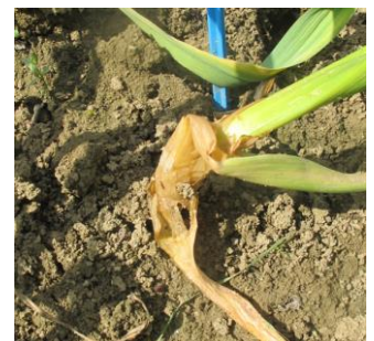
Affaissement de la plante

La maladie café au lait est causée par une bactérie tellurique, Pseudomonas salomonii . Si la bactérie est présente dans le sol, elle persiste également sur les tuniques des bulbes et les résidus de culture laissés au champ.