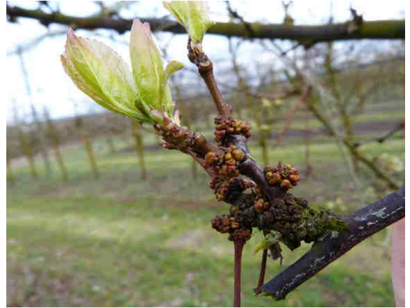
Galles de phytoptes sur September Yummy Photo CA82 (mars 2017)

Évaluation du risque : Début de la période de risque avec le début de la migration sur toutes les parcelles présentant des galles à la base des bourgeons.