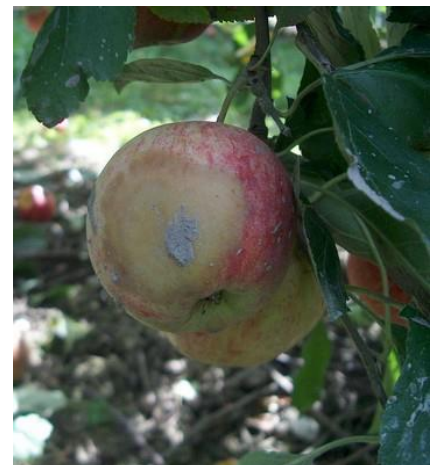
Phytophthora sur fruits - Photo CA82

Le Phytophthora est une pourriture ferme, de couleur brune. Elle affecte généralement des fruits souillés par la terre lors des pluies (fruits proches du sol) ou de la récolte.