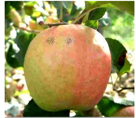
Maladie des « crottes de mouche »

Évaluation du risque : A surveiller, notamment en parcelles peu traitées en fongicides (dont variétés RT).