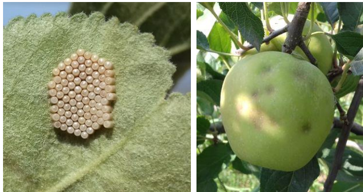
Œufs de N. viridula et dégâts estivaux de punaises sur fruits

Sur notre réseau de piégeage, nous capturons des adultes depuis début mai (date de pose des pièges) et des larves depuis mi-juin. Les premières captures de punaises diaboliques ont été enregistrées le 11 mai. Depuis mi-août, nous capturons beaucoup de larves de punaises diaboliques.