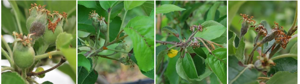
Dégâts de feu bactérien (fin avril 2020)

Nous observons les premiers symptômes au niveau du porte-greffe en vergers jeunes (2 èmes feuilles) et fortement contaminés, depuis le 18 juin.