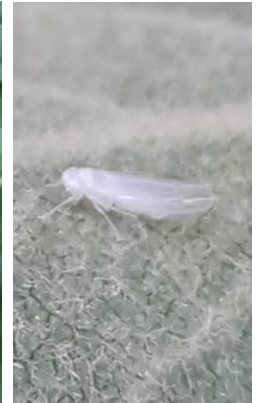
Cicadelle verte (dégâts et insecte)