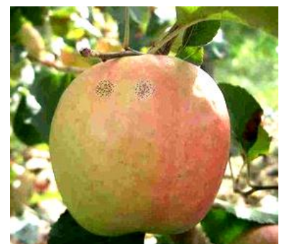
Maladie des « crottes de mouche » Photo CA82

Ces deux maladies sont souvent associées et peuvent occasionnellement provoquer des dégâts. La maladie de la suie provoque des plages noires qui, à la différence de la fumagine, ne partent pas en frottant. La maladie des crottes de mouche provoque de petites taches rondes, souvent regroupées en « coup de fusil », qui sont bien incrustées dans l'épiderme.