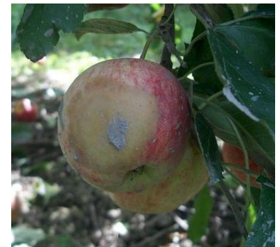
Phytophthora sur fruits - Photo CA82

Le Phytophthora est une pourriture ferme, de couleur brune. Elle affecte généralement des fruits souillés par la terre lors des pluies (fruits proches du sol) ou de la récolte.