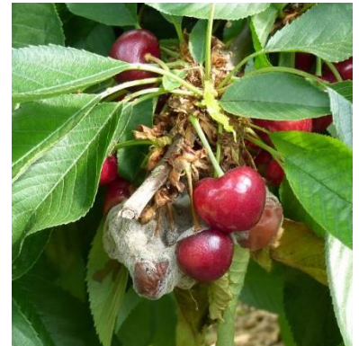
Foyer de monilia fruits