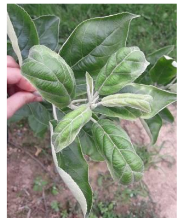
Cicadelle verte (dégâts et insecte)