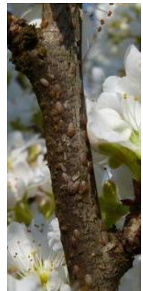
Cochenilles lécánines - Photo CA82

Évaluation du risque : La période de sensibilité des larves est en cours car le bouclier qui les protégera ensuite n'est pas encore formé.