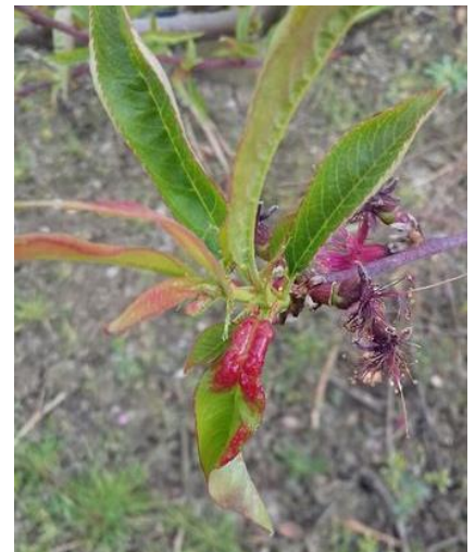
Cloque sur premières feuilles

Évaluation du risque : Le stade sensible est en cours sur l'ensemble des variétés. Les précipitations peuvent entraîner des contaminations.