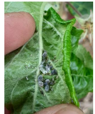
Foyer de pucerons cendrés Photo CA82