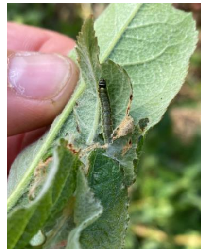
Dégâts et larve de capua sur pousse : feuilles collées entre elles avec tissage blanc

Mesures prophylactiques : la lutte par confusion sexuelle permet de limiter les populations et de diminuer l'usage des insecticides tout en améliorant l'efficacité de la protection. Les diffuseurs doivent être mis en place avant le début du vol (fin avril).