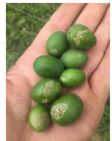
Dégât escargot, Photo Maxime Delbouis Qualisol 2023

Évaluation du risque : A surveiller. Sur les parcelles avec forte infestation, poser les pièges (glue, tuiles, pots... tout ce qui peut faire de l'ombre et peut être sorti hors de la parcelle).