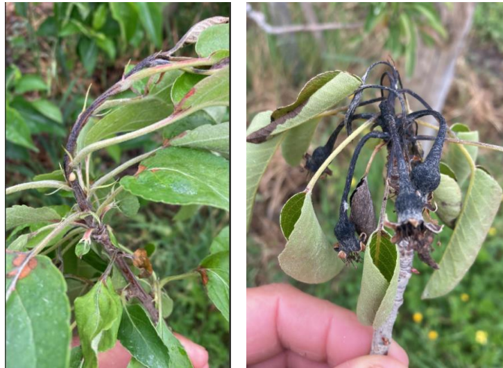
Symptômes de feu bactérien sur pousses (pommier à gauche, poirier à droite)