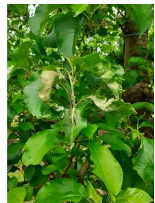
Pousse oïdiée ou « drapeau »

Mesures prophylactiques : La suppression des pousses oïdiées dès leur sortie permet de limiter les risques de repiquages.