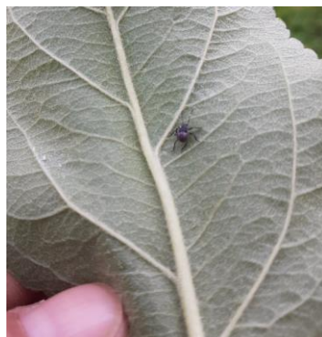
Jeune larve (L1) de punaise diabolique

Évaluation du risque : Risque localisé. A surveiller à la parcelle.