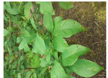
Taches et criblures bactériennes

Évaluation du risque : Risque fort. Les conditions humide et pluvieuse de cette semaine sont favorables aux bactérioses.