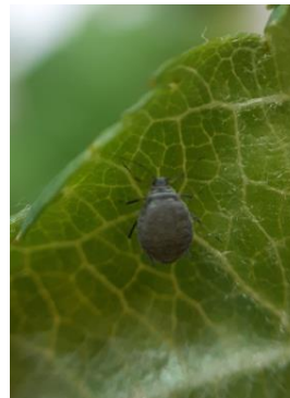
Fondatrice de pucerons cendrés