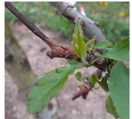
Chancre à nectaria

Évaluation du risque : Période de risque en cours et risque de contamination, en vergers contaminés, en cas de pluie.