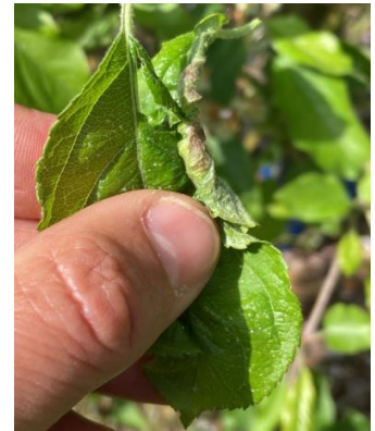
Dégâts de cécidomyies

Évaluation du risque : très faible risque