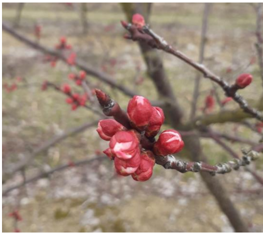
Abricotier, variété Wonder Cot, Stade C Photo CA82 2023