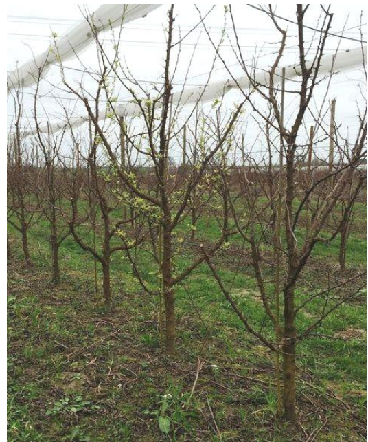
Arbre malade à feuillaison précoce

L'expression des symptômes est importante encore cette année en verger.