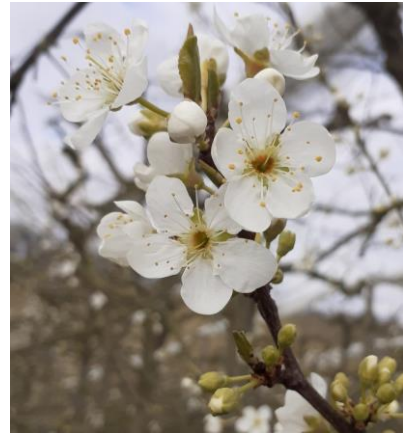
Prune Japonaises, variété Fortune, Stade F Photo CA82 2023