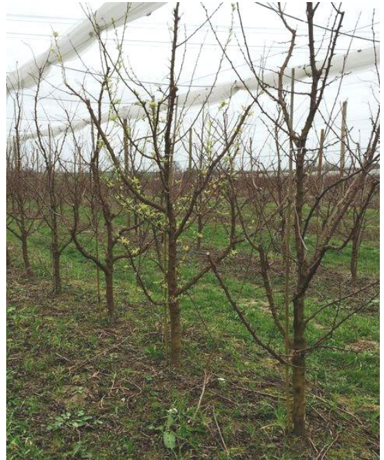
Arbre malade à feuillaison précoce

L'expression des symptômes est importante encore cette année en verger.