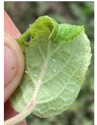
Foyer de pucerons cendrés et oeufs de syrphes