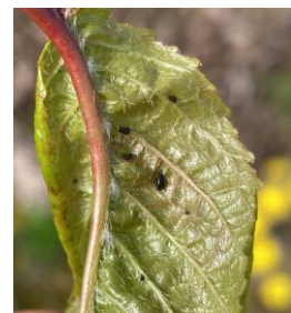
Petit foyer de puceron noir du cerisier

Évaluation du risque : Risque moyen. La période de risque a débuté avec l'éclosion des fondatrices et les premiers foyers. A surveiller attentivement car les foyers de ce puceron peuvent se développer rapidement.