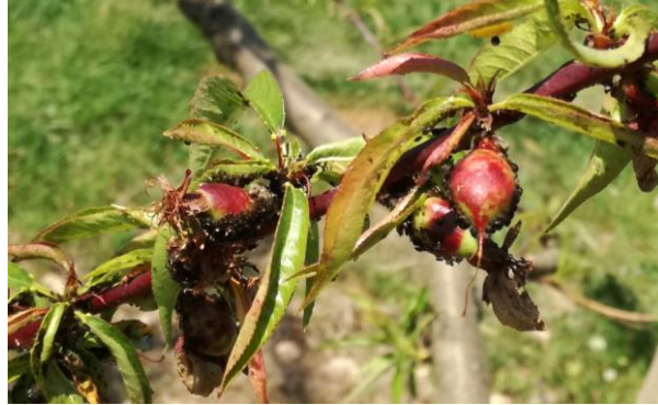
Puceron noir sur pêcher