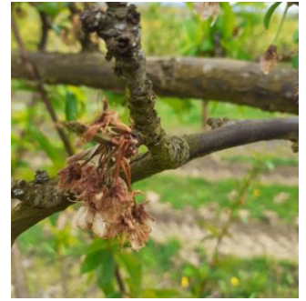
Monilia Fleur sur Prunier américano-japonais

Quelques symptômes ont été observés. Sur parcelles avec une protection plutôt légère, des symptômes plus importants sont observés tout en restant modérés.