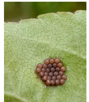
Ooplaque de punaise (pas d'indication précise de l'espèce, mais il ne s'agit ni de la punaise diabolique, ni de punaises vertes)

Évaluation du risque : Risque localisé. A surveiller à la parcelle.