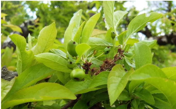
Dégâts d'hoplocampe sur Prunier américano-japonais

Mesures prophylactiques : la lutte par pulvérisation de nématodes est conseillée au moment des toutes premières captures donc maintenant. Elle permet en théorie de limiter les populations et donc de diminuer l'usage des insecticides.