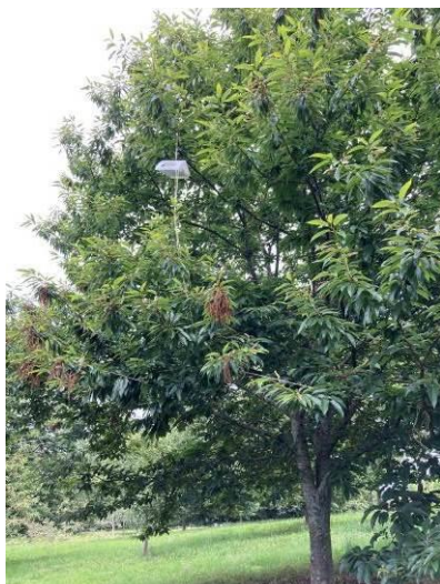
Piège à phéromone posé au plus près des fruits