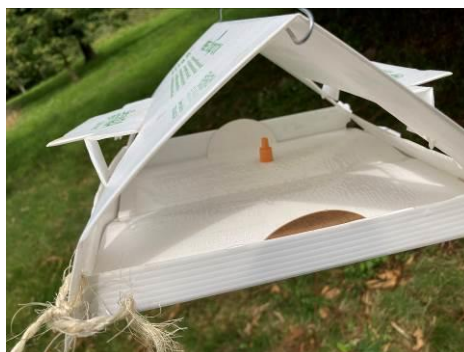
Phéromone attirant les papillons mâles de la tordeuse de la châtaigne, piégés sur une plaque engluée