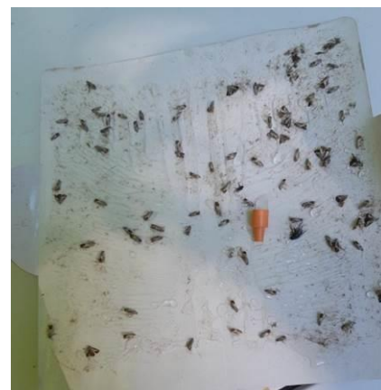
Plaque engluée Producteur à Coussac Bonneval 4 juillet 2022