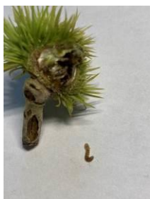
Jeune bogue infestée chutée au sol début août.