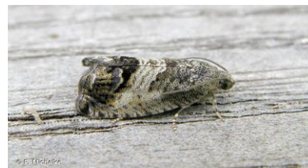
Papillon adulte (Imago) de carpocapse de la châtaigne ( Cydia splendana )

Les premiers papillons ont été piégés ces deux dernières semaines essentiellement en Dordogne et Charente.