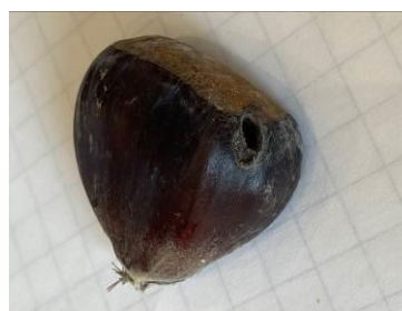
Trou de sortie de la larve de tordeuse à la récolte (Plus gros que celui du carpocapse)