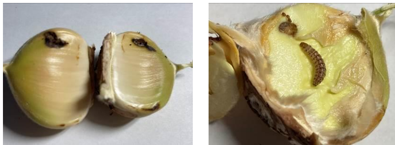
Bouche de Bétizac - Attaque de deux châtaignes dans une bogue – Présence d'une larve de la tordeuse. Allasac en Corrèze, le 9/08/2022

Attaques des châtaignes par les larves de tordeuses visibles.