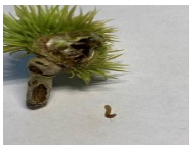
Jeune bogue infestée chutée au sol début août.