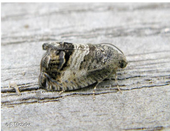
Papillon adulte (Imago) de carpocapse de la châtaigne ( Cydia splendana )