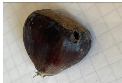
Trou de sortie de la larve de tordeuse à la récolte