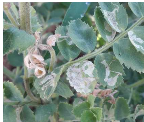
Galleries de mineuses dans feuilles de pois chiche

A ce jour, il n'existe pas de solutions autorisées pour lutter contre ce ravageur et la nuisibilité de ce dernier est mal connue en France. Dans les cas les plus graves, l'évolution des galeries provoquent une défoliation rapide des tiges touchées.