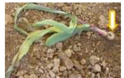
Vers gris et dégâts

L'activité du ravageur reste modérée pour l'instant. Cependant, L'humidité ambiante favorise la survie des premiers stades larvaires, à la surface du sol. L'activité de ce bio-agresseur devrait être renforcée par l'augmentation des températures maximales journalières.