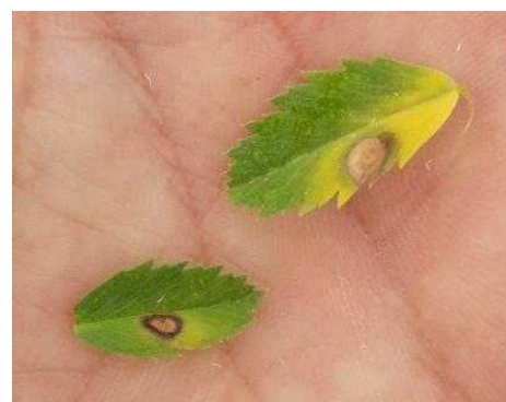
Symptômes caractéristiques d'ascochyte sur pois chiche

Mesures prophylactiques : L'utilisation de semences saines et la gestion des résidus de culture sont des mesures prophylactiques indispensables pour atténuer ou éviter la maladie. Pour être pleinement efficace, ces actions doivent être mises en place à l'échelle du territoire.