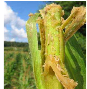
Sésamie – Pied de ponte

Les captures, de faible ampleur, sont en diminution depuis le précédent bulletin, malgré les conditions plus favorables pour les papillons. C'est la dernière phase du vol de première génération. Le stade baladeur, où un maximum de jeunes larves est exposé, est atteint pour tout le territoire, dépassé pour les secteurs les plus chauds. Des pieds de pontes sont observés sporadiquement sur l'ensemble du territoire. Dans les secteurs les plus avancés, les larves ont déjà colonisées les pieds voisins de la plante initiale, et ont pénétré à l'intérieur des maïs.