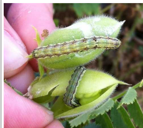
Chenilles d' H. armigera dans gousses de pois chiche