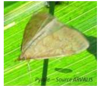
Papillon de pyrale

Des captures de papillons sont recensées dans l'ensemble des pièges mis en place, souvent en effectifs marqués. L'absence de pluie permet aux papillons de voler sans contrainte. Le pic de vol est dépassé pour les secteurs les plus chauds du territoire, mais toujours en cours pour les secteurs les plus froids.