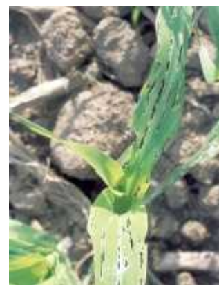
Dégâts de limaces

Évaluation du risque : Surveillez les parcelles, du semis et au moins jusqu'à 6 feuilles. Risque moyen à fort