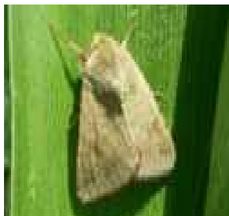
Papillon d' H. armigera

Évaluation du risque : Les conditions ne sont toujours pas propices à l'émergence en grand nombre des papillons. Attention tout de même, les fortes chaleurs qui sont prévues pourraient activer le vol. Un point sera réalisé dans le prochain BSV.