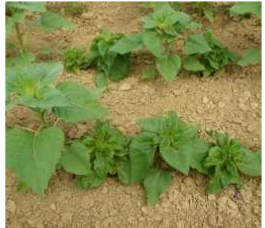
Mildiou sur tournesol.

Si vous rencontrez des situations avec un taux d'attaque significatif (>5 % de pieds touchés en moyenne sur la parcelle), contactez Terres Inovia ou la FREDON Aquitaine (05.56.37.94.76) afin de réaliser un prélèvement pour déterminer la race présente.