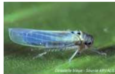
Cicadelle bleue

Seuil de nuisibilité : atteint quand la feuille de l'épi porte des traces blanches et que les feuilles immédiatement inférieures sont desséchées.