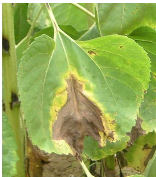
Symptômes de phomopsis sur feuille

Les observations réalisées en 2017 sur les parcelles de tournesol des anciennes régions administratives Aquitaine et Midi-Pyrénées ont montré que la maladie a été autant présente qu'en 2016 (stable, - 6 % sur 263 parcelles enquêtés).