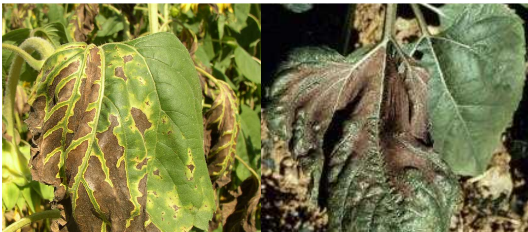
Verticillium sur tournesol