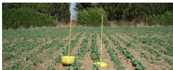
Cuvettes jaunes en situation.

Seuil indicatif de risque : 8 pieds sur 10 avec morsures.