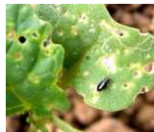
Petite altise sur colza.

Soyez attentifs dans les bordures de parcelles.