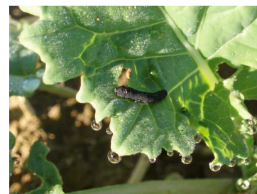
Larves de tenthrède.

Seuil indicatif de risque : 25 % de la surface foliaire détruite par les larves de tenthrèdes.