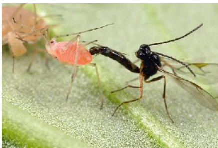
Aphidius colemani : Adulte (2 mm)

Les femelles recherchent les foyers de pucerons et pondent, avec leur tarière, à l'intérieur du puceron entraînant sa mort et la naissance d'un nouvel auxiliaire. Aphidius colemani attaquent les pucerons ailés et les larves. Le puceron parasité prend l'aspect d'une momie brune dorée, fixée sur la feuille.