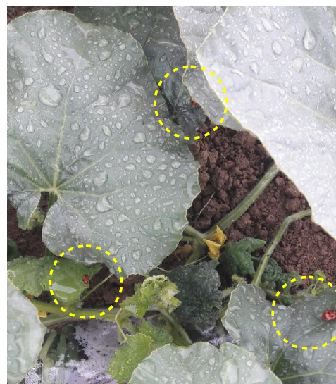
Foyers de pucerons et coccinelles sur plant de melon

Pour la sésamie , le pic de vol de la première génération est atteint. Le stade baladeur est prévu entre le 5 et le 9 juin.