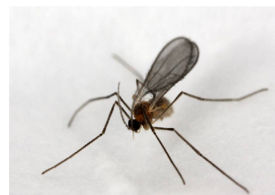
Adulte, 2.5 mm, pattes longues