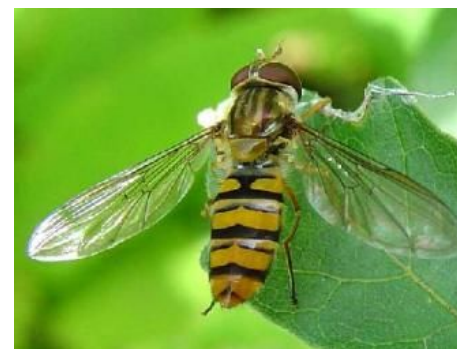
Syrphid adulte (4mm à 3cm selon les espèces)