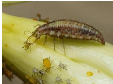
Larve de chrysope

Les conditions optimales de son développement : 15-30°C.