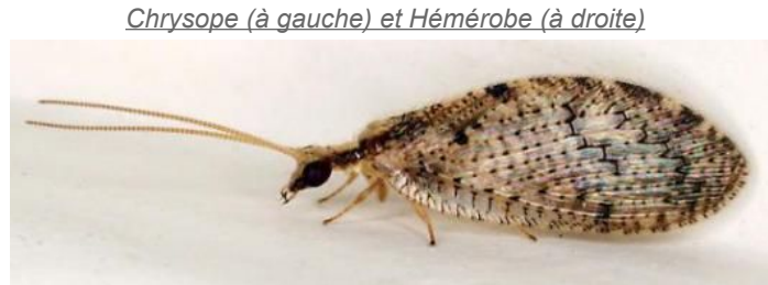
Chrysope (à gauche) et Hémérobe (à droite)

Les adultes se nourrissent de pollen et de nectar. Seules les larves se nourrissent de pucerons. Elles sont actives la nuit et sont donc difficiles à observer. La larve capture sa proie à l'aide de ses crochets et peut consommer 200 à 500 pucerons au cours de son développement (15 à 20 jours – 3 stades larvaires).