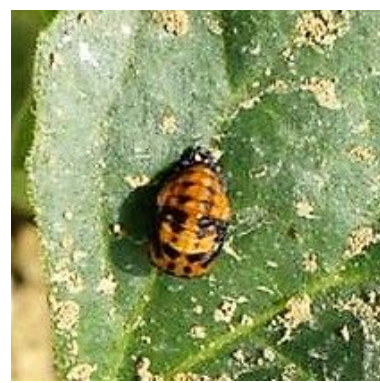
Coccinelle à 7 points (Coccinella septempunctata) : œufs, larve et nymphe