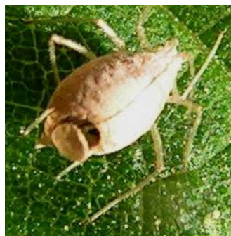
Opercule de sortie sur la momie de puceron

Les conditions optimales de son développement : 18-25°C (bonne adaptation aux conditions du sud-ouest de la France). En conditions favorables, température de 20°C, un adulte quitte la momie par un trou rond au bout de 7 jours.