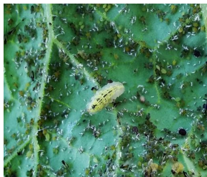
Larve de syrphid (aspect de petite limace)

La durée du cycle de développement est très influencée par la température.