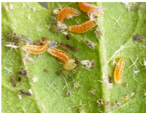
Larves des cécydomyies

Les conditions optimales de son développement : 15-25°C et forte humidité.