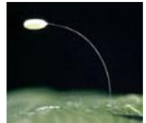
Œuf pédonculé de chrysope