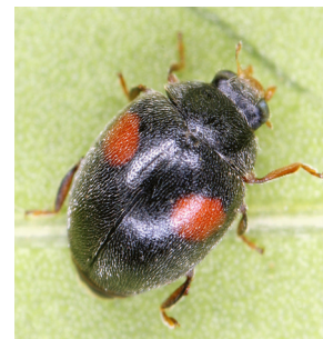
Scymnus (< 2mm)