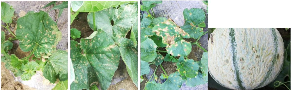
Symptômes de bactériose sur feuilles et fruits

L'indice de risque annonce un risque très faible à faible jusqu'au 21 aout et qui reste faible jusqu'au 24 aout.