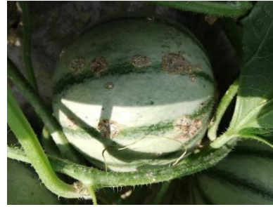
Symptômes de cladosporiose sur feuilles, tige et fruit

Pour la bactériose , il existe un Outil d'Aide à la Décision (OAD) : l'indice de risque bactériose. Il est calculé par le CEFEL à partir de données de températures et de pluviométries pour des cultures « non couvertes ».