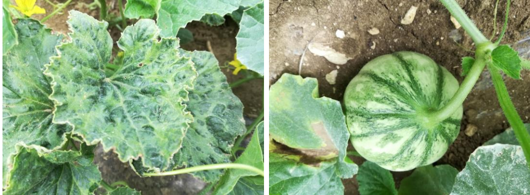
Symptômes de viroses sur feuilles et sur fruit

Des symptômes de viroses sont observés sur le réseau et ils semblent se développer.