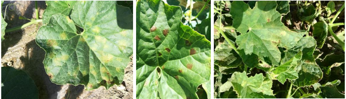
Symptômes de mildiou

Évaluation du risque : Avec la climatologie actuelle, le risque est moyen à fort en fonction des parcelles, surtout si les humectations du feuillage sont importantes.