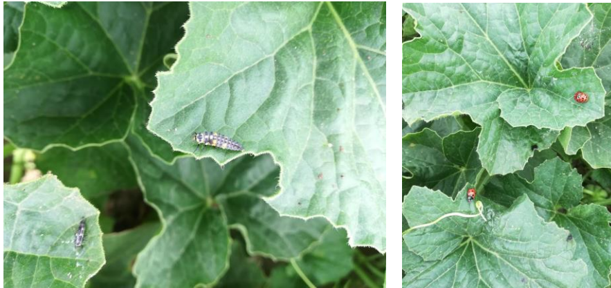
Coccinelles aux stades larve et adulte