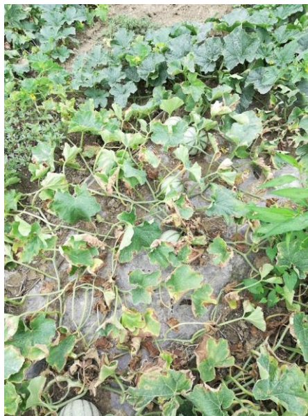
Dépérissements de plantes

Des dépérissements de plantes sont de nouveau observés.