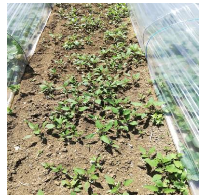
Développement des adventices

Toujours des levées et développements d'adventices. D'autant plus difficiles à gérer quand les levées se situent sur la zone de terrage et (ou) sur la zone entre le paillage et la couverture temporaire. Les pluviométries favorisent les levées et leur développement.