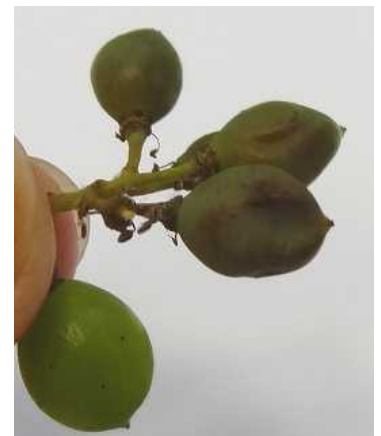
Mildiou sur grappe : faciès "rot brun" en haut : teinte violacée et baies desséchées en bas : dépression en coup de pousse