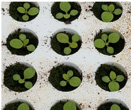
Semis stade croix (BBCH 1020)