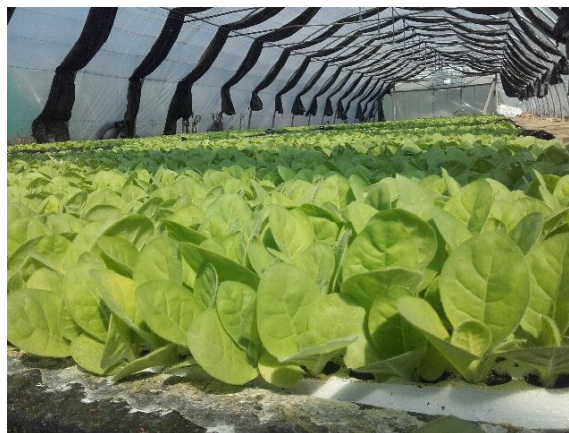
Semis stade 1 er faucillage (BBCH 1080)