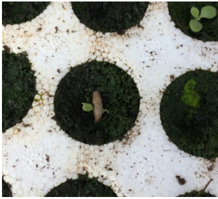
Limace sur plant de tabac