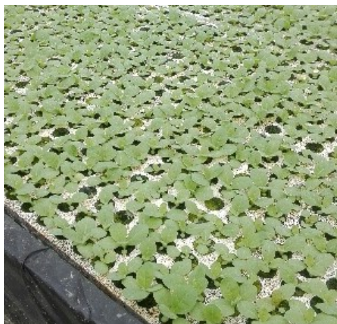
Semis du 10 mars 2017

Sur les parcelles de Loupiac de La Réole (33), Puch d'Agenais (47) et de Sainte Livrade sur Lot (47), le stade 4 feuilles est atteint (BBCH 1040). Les semis de la parcelle de Saint Pierre d'Eyraud (24) ont dépassé le stade croix et ont quasiment atteint le stade 4 feuilles. Dans le secteur de Lanzac (46), les semis vont du stade 2 cotylédons à 1 er faucillage.