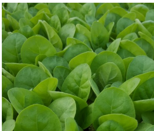
Semis stade 4 feuilles (BBCH 1040)

Le stade 1 er faucillage (BBCH 1080) est observé dans les zones de La Fouillade (12) et Guinarthe-Parentis (64).