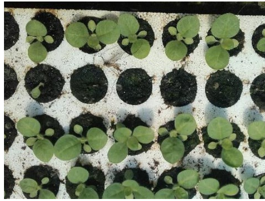
Dégâts de limace