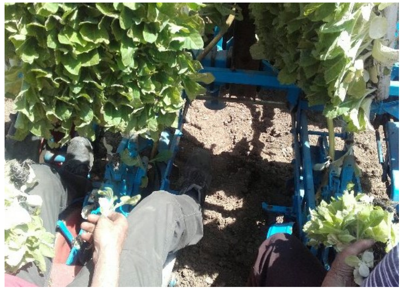
Plantation du tabac