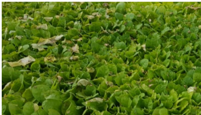
Plants atteints d' Olpidium