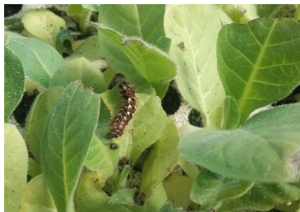
Chenille sur plant bio

Quelques dégâts de chenilles défoliatrices sont repérés dans la zone de Villefranche de Rouergue (12) sur 1 ha. Les dégâts restent faibles (1% des plants).