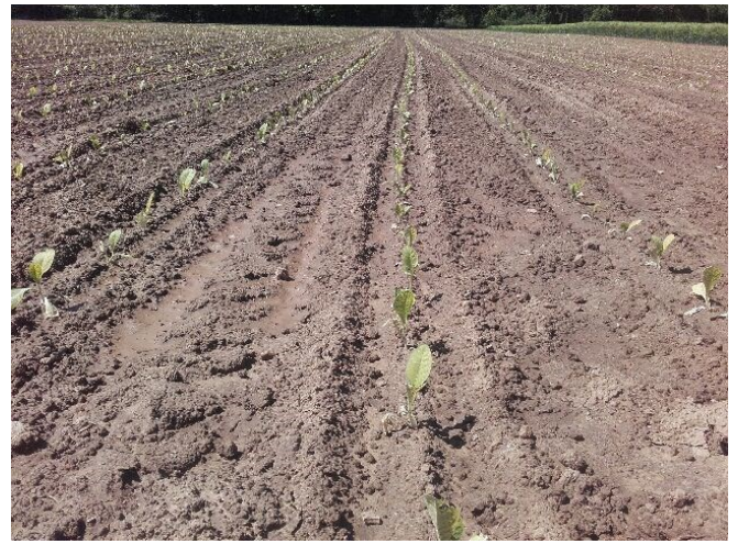
Plantations de tabac