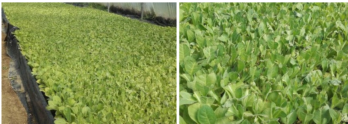
Virginie bio faucillé, prêt à planter

La plantation a débuté sur la parcelle de Loupiac de La Réole (33). Si les conditions climatiques le permettent, les plantations dans les autres zones auront lieu dans les prochains jours.