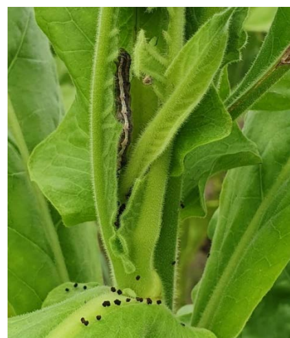
Chenille défoliatrice sur feuilles de tabac