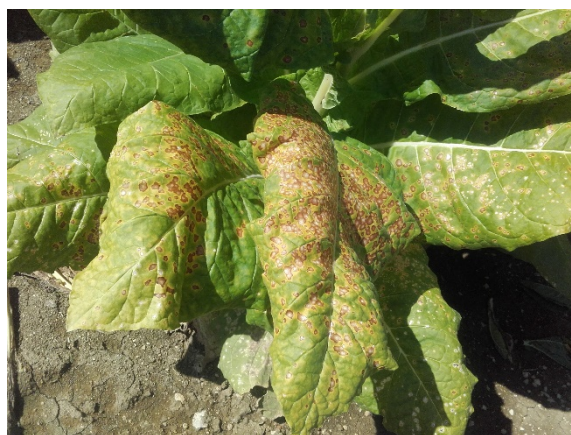
Alternariose sur feuilles de tabac