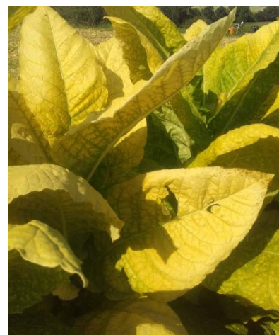
Stolbur sur tabac

Le Stolbur poursuit sa progression où l'on observe des symptômes de l'ordre de 28 % dans la parcelle de référence de Masseube (32). Mais également une hausse en tour de plaine, dans plusieurs secteurs comme celui de Saussens (31) où sa présence est fortement visible sur 43 ha. Mais aussi sur Saint-Sylvestre-sur-lot (47) et Souillac (64) sur 5 ha ainsi que sur 12 ha dans le secteur de La Fouillade (12).