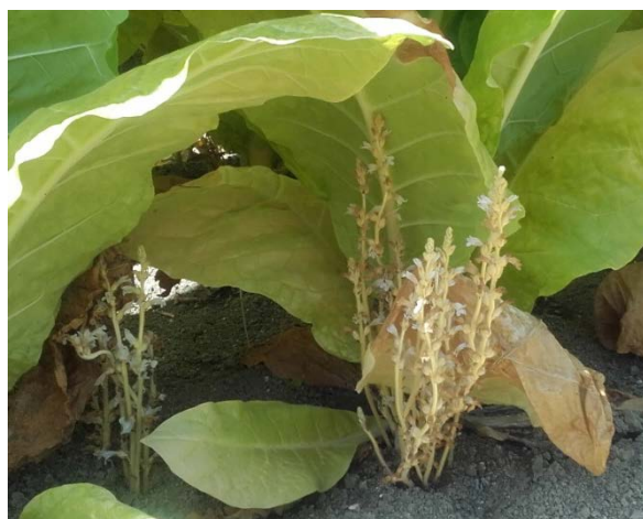
Orobanches rameuses sous pied de tabac