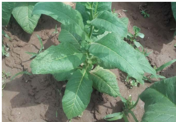
CMV sur Tabac (à gauche) et PVY sur tabac (à droite)