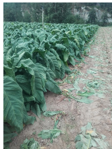
Burley en cours de récolte

La parcelle de Masseube (32) est au stade Début de récolte Virginie 20 % (BBCH8090) et les parcelles d'Aillas (33), de Cuzorn (47) sont au stade fin de récolte Virginie 80% (BBCH8090).