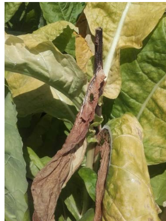
Sclérotinia sur feuille de Tabac