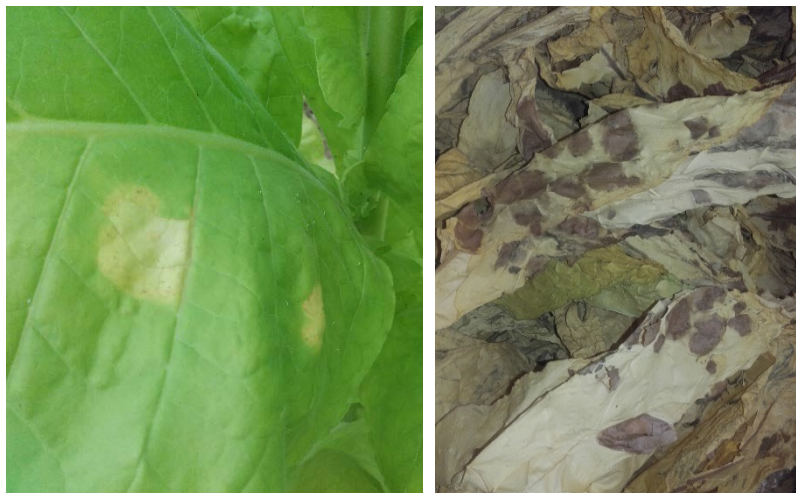
Mildiou sur feuille de tabac (à gauche) et taches de mildiou au séchage (à droite)