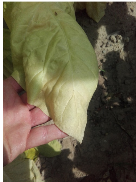
Gris au champ du Virginie

Les structures partenaires dans la réalisation des observations nécessaires à l'élaboration du Bulletin de santé du végétal Grand Sud-Ouest Tabac sont les suivantes : ARVALIS – FREDON Aquitaine - Périgord Tabac - Tabac Garonne Adour - Midi Tabac – Coopérative Tabac Feuilles de France (CT2F).