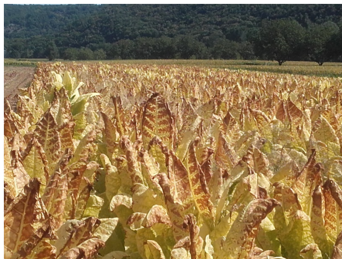
Alternaria et insolation sur feuilles de tabac