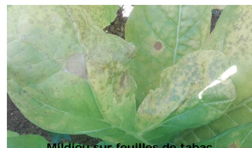
Mildiou sur feuilles de tabac