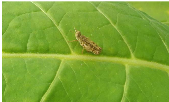
Criquet sur feuille de Tabac