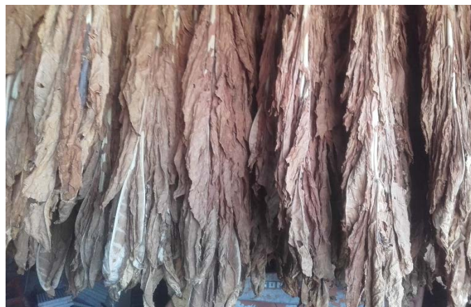
Phase de réduction des côtes en Vallée du Lot

Les récoltes sont en cours en tour de plaine, notamment pour le secteur de La Fouillade (12), où on retrouve le Burley en phase de réduction des côtes en Vallée du Lot. C'est également la récolte des médianes à feuilles de tête pour le secteur d'Aizenay (85).