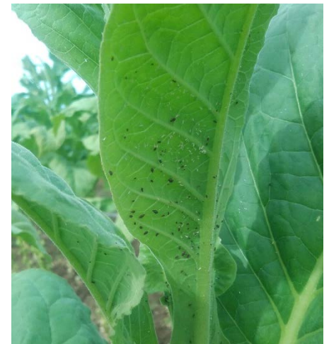
Pucerons sous feuilles de tabac

Beaucoup moins présents depuis les derniers BSV, on observe des symptômes sur 2 ha du tour de plaine de La Fouillade (12).