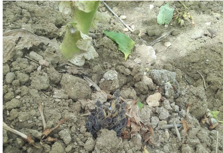
Orobanches rameuses sous pied de tabac