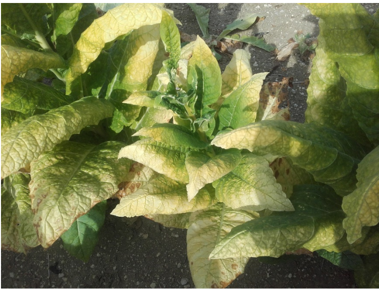
Stolbur sur plants de tabac