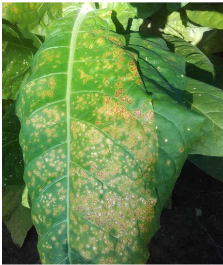
Alternariose sur feuille de tabac