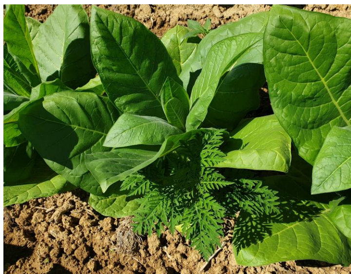
Carex et amброisie à feuilles d'armoise près des plants de tabacs