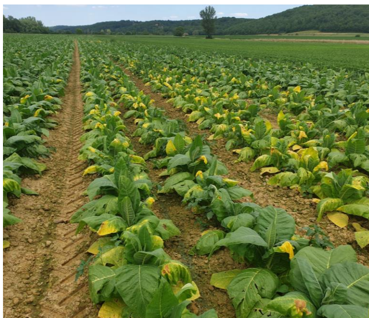
Dégâts des eaux sur les tabacs

Des captures d' Agrotis ipsilon et segetum sont enregistrées sur la parcelle de référence de Saint-Ignat (63).