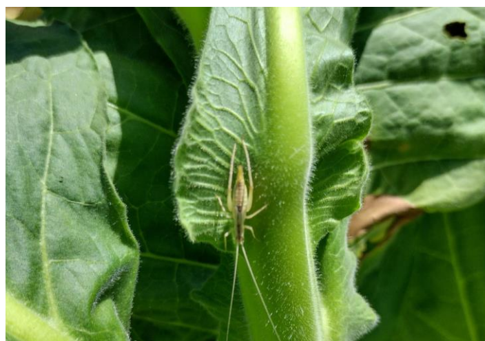
Grillon Oechanthus spp sur tabac (gauche) et récolte de feuille de tabac (à droite)

Ce BSV a été rédigé avec des informations collectées sur 10 parcelles de référence et sur 1 005 ha plantés pour les tours de plaine.