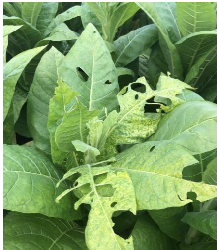
Noctuelles défoliatrices et ses dégâts