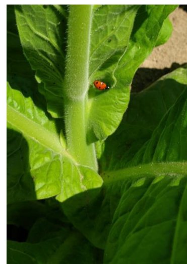
Micro-hyménoptère (à gauche), syrphe sur feuille de tabac (au milieu) et coccinelle (à droite)