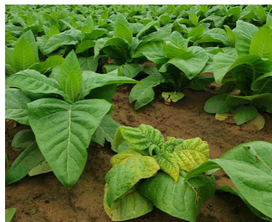
Viroses AMV, CMV, TMV et PVY sur plants de Tabac