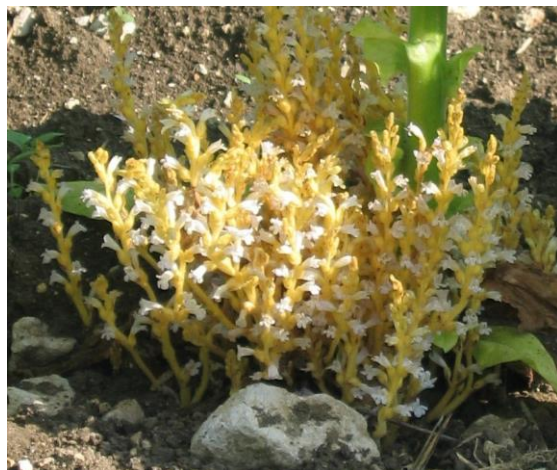
Orobanche rameuse au pied des tabacs

En tour de plaine, on observe l'émergence de quelques orobanches rameuses sur le secteur de Chemillé (49) avec des dégâts de moins de 20 % sur 26 ha. On remarque sa forte présence sur 65 ha pour la zone de Vivonne (86), avec des dégâts de moins de 20 % sur 22 ha. Sur 136 ha on observe des symptômes sur Schnersheim (67) et sur 1 ha pour le secteur de Castelnau-Montratier (46).