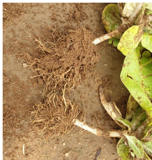
Nématodes à galles visibles sur les racines -

En tours de plaine, on note également la présence de nématodes sur 1 ha pour le secteur de Castelnau-Montratier (46). Dans le secteur de Loupiac-de-la-Réole (33), des dégâts repartent avec une fréquence d'attaque supérieure à 20 % sur 4 ha sur deux parcelles. Enfin ils sont beaucoup plus présents sur 5 ha dans la zone de Bourran (47) avec des dégâts de moins de 20 %.