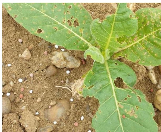
Dégâts dans une parcelle de Burley

En tours de plaine, on signale la présence d'altises sur le secteur de Loupiac-de-la-Réole (33) sur 5 ha. Elles sont assez actives sur le secteur de Bourran (47), où l'on note sa présence sur 25 ha avec des dégâts de plus de 20 %.