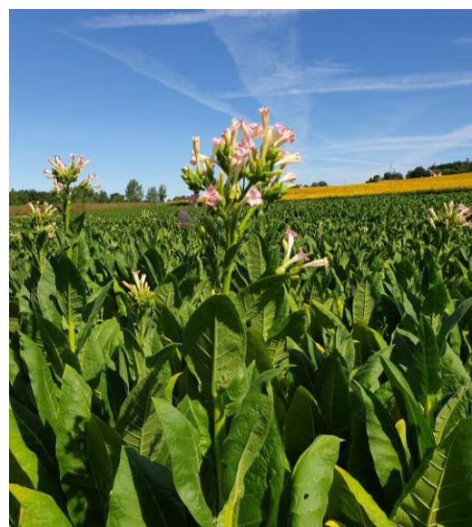
Flours de tabac ouvertes

Les fortes températures provoquent le jaunissement des feuilles basses et un stress hydrique important (suite à une irrigation limitée ou interdite) pour de nombreux secteurs dont ceux des départements de Gironde (33), Vienne (86), Hautes-Pyrénées (65) et Dordogne (24). C'est la fin de l'écimage pour le tabac Brun et le début de l'écimage pour le Burley dans le département de la Dordogne (24). Pour la zone de Chemillé (49), on note que les récoltes sont en cours mais stoppées par la sécheresse avec plus de 50 % de la surface impactée par le manque d'eau. Plusieurs stades sont observés sur le secteur de Beaurepaire (38), où l'inhibition est en cours. Dans de nombreux secteurs on observe la présence de viroses AMV, CMV, TMV et PVY avec une pression parasitaire stable. Cependant on note des dégâts importants localisés de grillons ( Oechanthus spp ) sur boutons floraux dans 7 ha de la zone de Sardieu (38). La pression des adventices est en baisse dans de nombreux secteurs, avec toutefois une présence accrue dans le Lot (46). L'orobanche fait son apparition avec un développement rapide dans plusieurs secteurs, Vivonne (86), Schnersheim (67) et Chemillé (49).