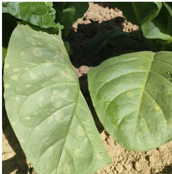
Mildiou sur feuilles de tabacs brun – Sporulations en face inférieure (à gauche) et taches en face supérieure (à droite)

En tour de plaine, le mildiou fait sa première apparition pour le secteur de Loupiac-de-la-Réole (33) où l'on note des dégâts de moins de 20 % sur 5 hectares. Deux foyers ont été signalés dans le Lot-et-Garonne (47).