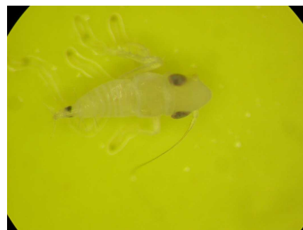
Larve de S. titanus vue à la loupe binoculaire (taille réelle 2 mm)

Cette cicadelle n'a qu'une seule génération par an. Les œufs éclosent dans le courant du mois de mai pour donner naissance à une larve. Puis cinq stades larvaires se succèdent. Six à huit semaines après les premières éclosions, les premiers adultes apparaissent. La période des éclosions peut être très étalée. Les larves naissent saines mais peuvent rapidement acquérir le phytoplasme si elles se nourrissent sur un cep conta-miné. Un mois plus tard, elles deviennent infectieuses et peuvent transmettre le phytoplasme à d'autres souches. Les nouveaux pieds ainsi contaminés n'exprimeront les symptômes que l'année suivante.