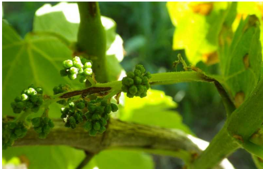
Black-rot sur inflorescence – lésion sur la rafle

Les premiers symptômes sur rafles visibles.