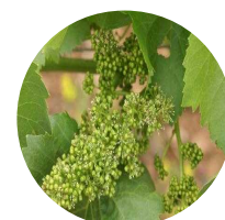
Stade 19: début de floraison