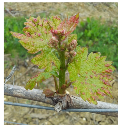
Erinose : dégâts précoce sur jeunes feuilles Photo CA 82

Les femelles hivernent dans les écailles des bourgeons et colonisent très tôt les jeunes feuilles pour se nourrir et pondre. Très rapidement après le débourrement démarre une phase de reproduction de l'acarien au cours de laquelle seront produites les populations d'adultes des premières générations estivales qui vont migrer vers le bourgeon terminal et les nouvelles feuilles des rameaux. Cette migration démarre fin mai et s'intensifie après la floraison.