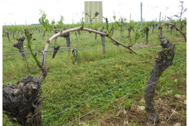
Escargots : « Petit gris » grignotant un jeune rameau et feuillage entièrement détruit (mai 2016)