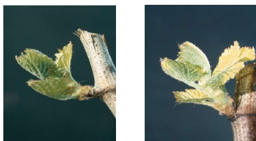
Rappel des stades de sensibilité de la vigne aux contaminations par l'excoriose = stade 6 (sortie des feuilles) à stade 9 (premières feuilles étalées)

La période de sensibilité de la vigne s'étend du stade 6 (éclatement des bourgeons/sortie des feuilles) au stade 9 (premières feuilles étalées). La croissance végétative met ensuite la partie terminale sensible du sarment hors de portée des contaminations par le champignon.