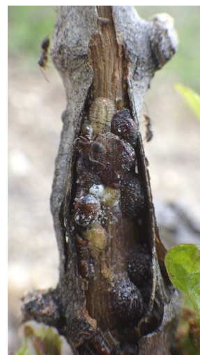
Cochenilles lécanines sur rameau de vigne

Les cochenilles se nourrissent de la sève en piquant les tissus végétaux. Ces prélèvements répétés peuvent affaiblir le cep, en cas de population importante. Par ailleurs, les cochenilles sont vectrices du virus de l'enroulement.