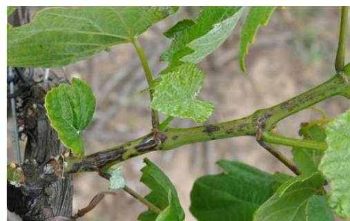
Lésion sur jeune rameau

📌 Mesures prophylactiques : Les bois porteurs de lésions doivent être éliminés autant que possible lors de la taille d'hiver.