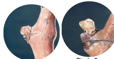
Stade 1 : Bourgeon d'hiver

Les températures douces annoncées pourront être favorables à une progression de la phénologie.