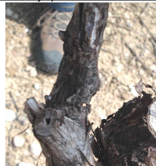
Chancre d'excoriose sur bois d'un an - Photo CA 81