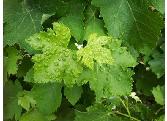
Erinose sur jeunes feuilles

Sècheresse : des symptômes sont observés sur feuilles de la base sur sols superficiels de plateau.