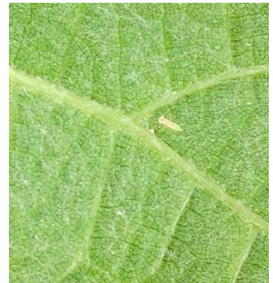
Larve de cicadelle verte

Mesures prophylactiques : L'application d'argile comme barrière physique est à mettre en place avant l'installation significative des populations.