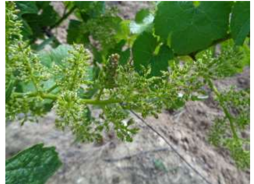
Glomérules – Photo CA81

Les stratégies de gestion les plus efficaces sont réalisées en 2 ème génération selon le nombre de glomérules observés en fin de G1.