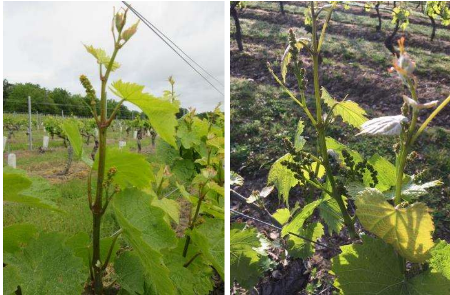
Stades « boutons floraux agglomérés » – Photo CA81 et « boutons floraux séparés » - Photo CA82

Sur le Brulhois, St Sardos et le Quercy, le stade majoritaire est toujours « boutons floraux séparés ». Les premiers signes de floraison sont visibles sur Merlot, Cabernet franc, Muscat et Abourriou dans le Brulhois.