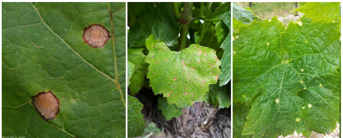
Taches de black-rot sur feuilles ( Ephytia ) vs Phytotoxicité d'épamprage chimique (CA81) à gauche et au centre Dégâts de désherbant (CA82) à droite

A cette période des symptômes de brûlure du feuillage liés à la dérive de produits désherbants peuvent apparaître. Ces taches sont plutôt d'aspect chlorotique et se distinguent des contaminations de black-rot par l'absence de liseré brun sur le pourtour de la tache.