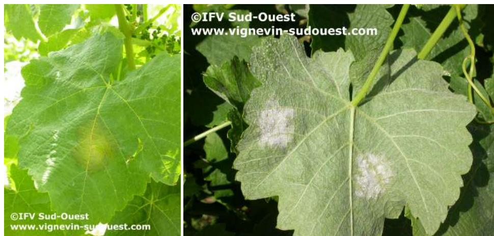
Symptômes de mildiou sur feuilles

Tarn et Garonne : signalement des toutes premières taches de mildiou sur Cabernet franc, Syrah et Mauzac. Ces symptômes restent rares et isolés. Ils sont très sporulants et semblent datés. Ils correspondraient aux toutes premières contaminations élités de fin avril.