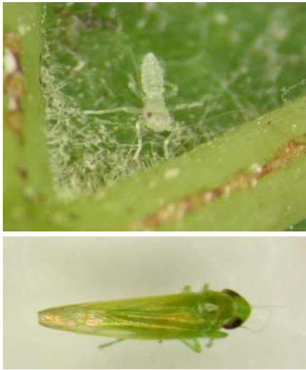
Cicadelle verte : Premier stade larvaire (à gauche) et adulte (à droite)

Mesures prophylactiques : L'application d'argile comme barrière physique est à mettre en place avant l'installation significative des populations.