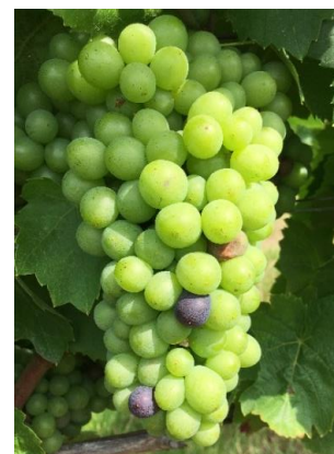
Premiers grains vérés sur Gamay