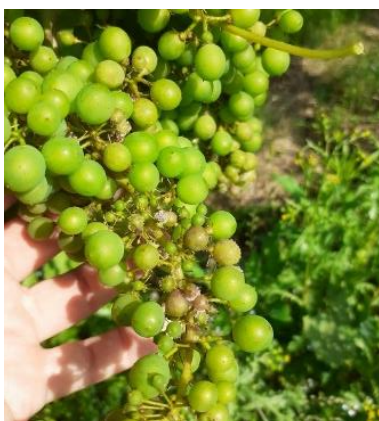
Mildiou sur grappes