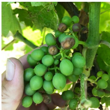
Black-rot sur baies