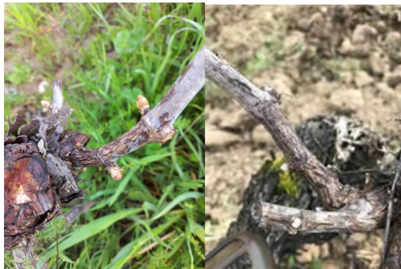
Excoriose : Symptômes sur bois

Les attaques apparaissent sur jeunes rameaux au printemps, quelques semaines après le débourrement, sous forme de taches brun-noir parfois d'aspect liégeux à la hauteur des premiers entre-nœuds.