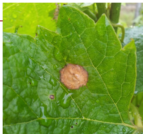
Black-rot : tache « fraîche » sur feuille et début de sporulation

De nouveaux passages pluvieux sont encore annoncés pour cette semaine. Il convient donc de rester vigilant.