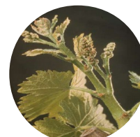
Stade 15 : Boutons floraux agglomérés

Stade 9 : 2-3 feuilles étalées Stade 10 : 3-4 feuilles étalées Stade 11 : 4-5 feuilles étalées Stade 12 : 5-6 feuilles étalées- grappes visibles Stade 13 : 6-7 feuilles étalées Stade 15 : boutons floraux agglomérés Stade 17 : boutons floraux séparés