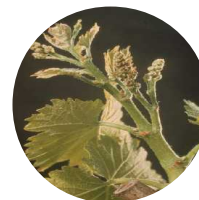
Stade 15 : Boutons floraux agglomérés

La hausse des températures au cours de la semaine écoulée a permis une reprise de la pousse. Les stades se sont homogénéisés entre les cépages.