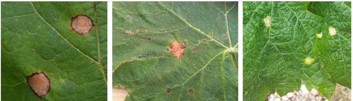
A gauche : Taches de black-rot sur feuille : nécrose entourée d'un liseré brun-rouge

Au moment des épannages, d'autres symptômes de phytotoxicité peuvent apparaître sur les feuilles du bas des souches. Dans un premier temps les deux types de symptômes sont semblables (taches chlorotiques entourées d'un liseré brun) puis l'apparition des pycnides noires sur les taches de black-rot permet de les distinguer.