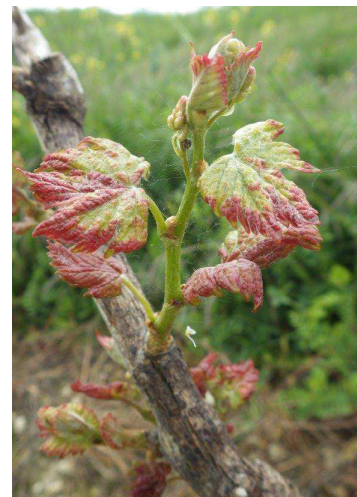
Erinose : dégâts précoce sur Muscadelle

Les femelles hivernent dans les écailles des bourgeons et colonisent très tôt les jeunes feuilles pour se nourrir et pondre. Très rapidement après le débourrement démarre une phase de reproduction de l'acarien au cours de laquelle seront produites les populations d'adultes des premières générations estivales qui vont migrer vers le bourgeon terminal et les nouvelles feuilles des rameaux. Cette migration démarre fin mai et s'intensifie après la floraison.