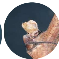
Stade 3 : Bourgeon dans le coton