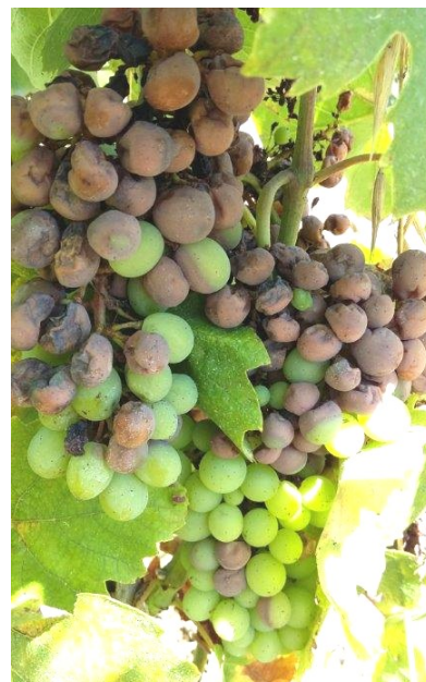
Black-rot sur grappes (24/07/2018)

Comme les semaines précédentes nous attirons votre attention sur le risque d'orages qui pourraient survenir consécutivement aux fortes chaleurs attendues.