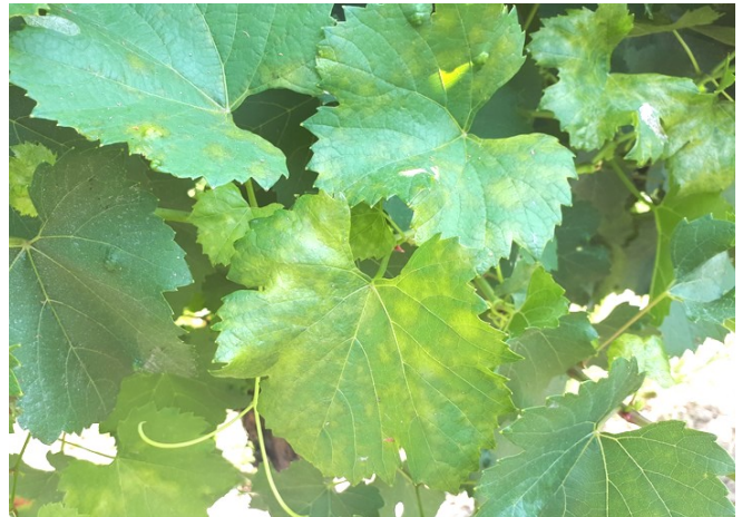
Mildiou sur feuille – Sorties régulières sur jeunes feuilles Photo CA 81 (30/07/2018)

On n'observe pas, cette semaine, de progression des dégâts sur grappes.