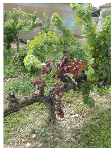
Symptômes de Flavescence sur cépage rouge - Photo CA81

L'ensemble des informations réglementaires relatives à la lutte obligatoire contre la cicadelle vectrice de la Flavescence dorée sont disponibles sur le site de la DRAAF Occitanie.