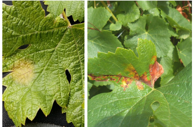
Mildiou sur feuille