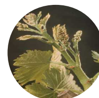
Stade 15 : Boutons floraux agglomérés

L'avance de phénologie observée jusque-là et évaluée à une dizaine de jours pourrait s'être fortement réduite à l'issue de la période de froid prolongée que nous venons de connaître.