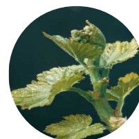
Stade 12 : Inflorescences visibles