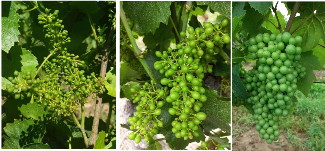
Stade 29 – Grains de plomb