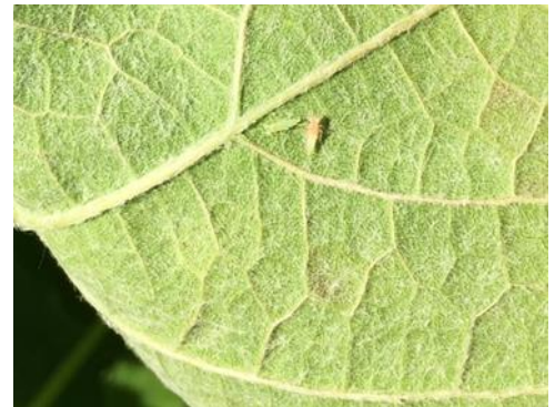
Larves de cicadelles vertes à 2 stades différents L2 et L4

Techniques alternatives : Des solutions de biocontrôle existent. Elles sont à appliquer sur des larves jeunes ou de manière « préventive ». Par exemple, l'application d'argile comme barrière physique est à mettre en place de manière préventive avant l'installation de population importante.