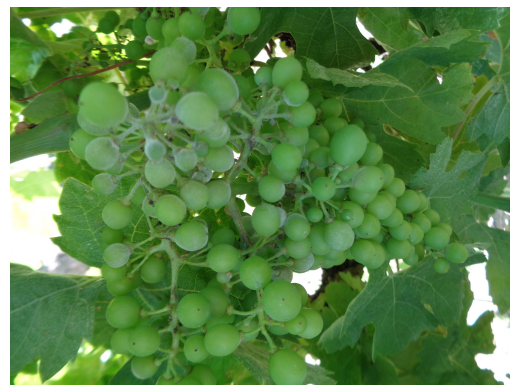
Oïdium – Duvet poudreux sur baies

Le développement du champignon est gêné par les conditions sèches et très lumineuses. Les symptômes se développent donc dans les parties les plus abritées des souches.