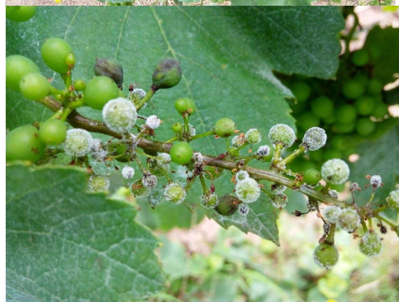
Mildiou – taches sur feuilles et rot gris et brun sur grappe