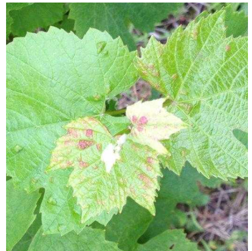
Erinose – symptômes estivaux sur jeune feuille

Évaluation du risque : La gestion du risque vis-à-vis de l'erinose dans les parcelles les plus sensibles repose sur une régulation précoce des populations, avant leur multiplication (aux stades 03-05). Les symptômes estivaux permettent de repérer les parcelles sensibles qui devront faire l'objet d'une surveillance accrue en début de campagne prochaine.