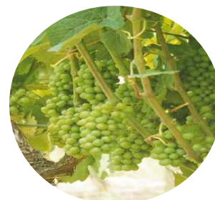
Stade 33 : Fermeture

Rq : Les stades indiqués concernent les parcelles ou rameaux non gelés.