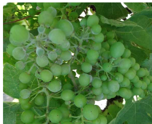
Oïdium – Duvet poudreux sur baies

📍 Mesures prophylactiques : L'effeuillage peut contribuer à la gestion du champignon en exposant les grappes à la lumière et en favorisant la pénétration de la pulvérisation.