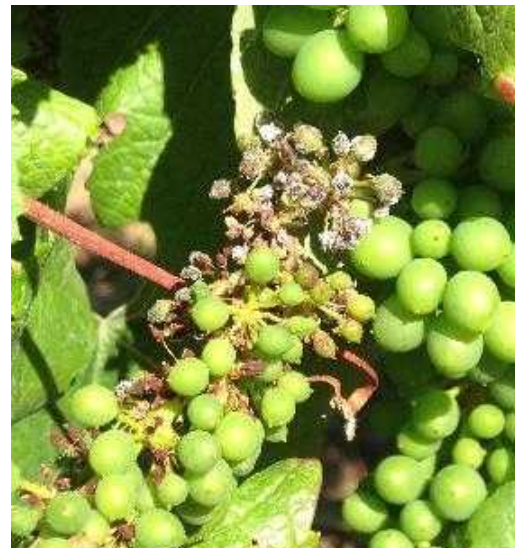
Mildiou – Rot gris sur grappe

Les contaminations pourraient être fortes sur les secteurs d'Objat et Verneuil.