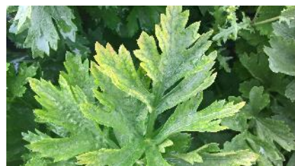
Carence Mg – Photo CA31

On observe parfois des jaunissements sur feuilles âgées, avec des taches nécrotiques possibles en bordure. Elles sont peut-être le signe de carence magnésienne (souvent induite).