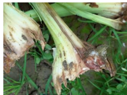
Sclérotinia – Photo SICCA Centrex

S'il est capable de se développer à des températures comprises entre 4 et 30°C, son optimum thermique se situe légèrement en dessous de 20°C. Il est favorisé par les périodes humides et pluvieuses et attaque les tissus ayant atteint un développement avancé.