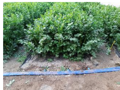
Céleri sur paillage et goutte à goutte

Des essais ont été conduits en station d'expérimentation avec du paillage plastique , combiné à du goutte à goutte avec des résultats intéressants.