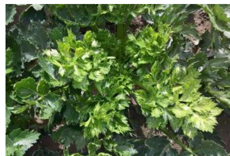
CeMV sur céleri - Photo CA 31

Dans ce mode de transmission, il n'y a pas de grande spécificité et un même virus peut être propagé par de nombreuses espèces de pucerons. Ainsi des pucerons non inféodés à une culture pourront jouer un rôle important dans la transmission virale par leurs simples piqûres d'essais.