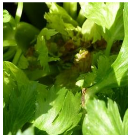
Cœur noir - Photo CA 31