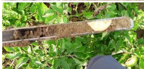
Sondes tensiométriques connectées, sonde capacitive connectée, humidité du sol sur 25 cm à l'aide d'une gouge