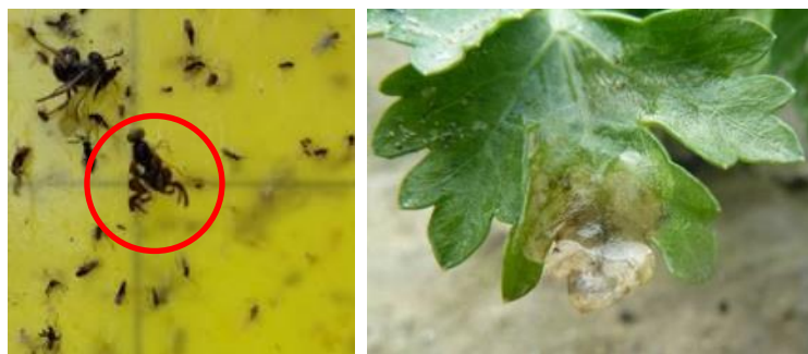
Mouche du céleri sur panneau jaune englué et dégât sur feuille de céleri Photos CA 31

Ce sont les larves qui causent les dégâts. Les feuilles sont parcourues de mines, les mines collectives se traduisant par une grosse cloque blanche devenant brune. Les excréments brillent par transparence, entre les 2 épidermes de la feuille. Les feuilles prennent ensuite une allure brûlée et desséchée.