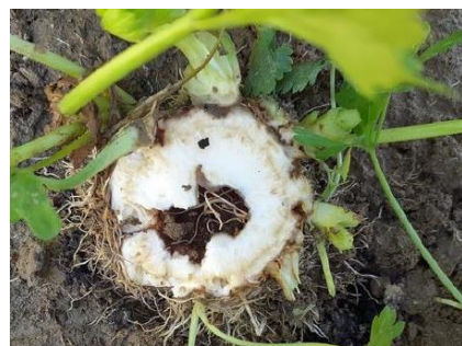
Cœur creux - Photo CA31

À la récolte, il est possible d'observer des pieds de céleri présentant un cœur creux et noir. Ce symptôme, non parasitaire, est lié à une mauvaise induction florale et une montaison qui a du mal à se produire. La dominance apicale est en partie inhibée et des bourgeons axillaires se développent. Des brûlures, consécutives à la rétention d'eau sur l'apex peuvent également conduire au développement du cœur creux. Dans certains cas, des microorganismes secondaires peuvent se développer et se multiplier, entraînant le brunissement superficiel des tissus.